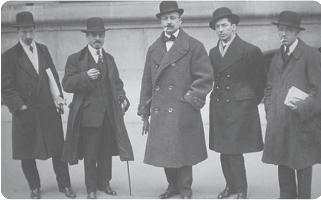
Luigi Russolo • Carlo Carrà • Filippo Tommaso Marinetti • Umberto Boccioni • Gino Severini (Parigi, 1912)

F ilippo Tommaso Marinetti, inventore del Futurismo, rinnovò l'arte e la cultura italiana in tutti i sensi. Perfino la cucina. Per lui l'arrivare a Bologna sembra coincidere con l'alloggiare al Baglioni: "Bologna, Baglioni". La sua firma appare costantemente sui registri dell'albergo che, già allora, era considerato un luogo d'eccellenza. Oggi al Grand Hotel Majestic "gia' Baglioni" si intende non solo ricordare uno dei personaggi più straordinari della storia italiana, ma, dedicando al suo nome il caffè dell'albergo, rendere costante la memoria di un poeta, scrittore, artista, animatore culturale, di cui tutta l'Europa va fiera, come tutti noi.